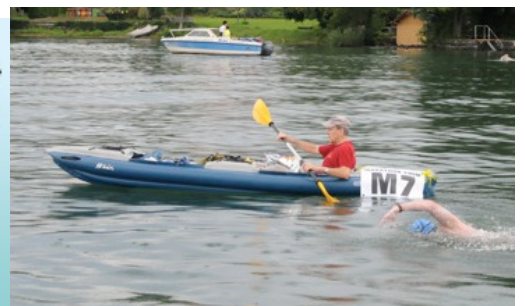
auf dem See

Aus Sicherheitsgründen werden folgende Boote nicht zugelassen: