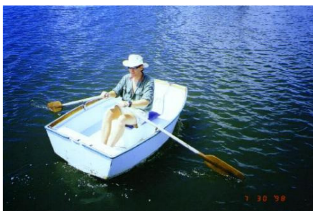
„Nusschalen“ - Ruderboote unter 2.50m

Aus Sicherheitsgründen werden folgende Boote nicht zugelassen: