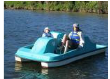
Pedalo und Surfbretter