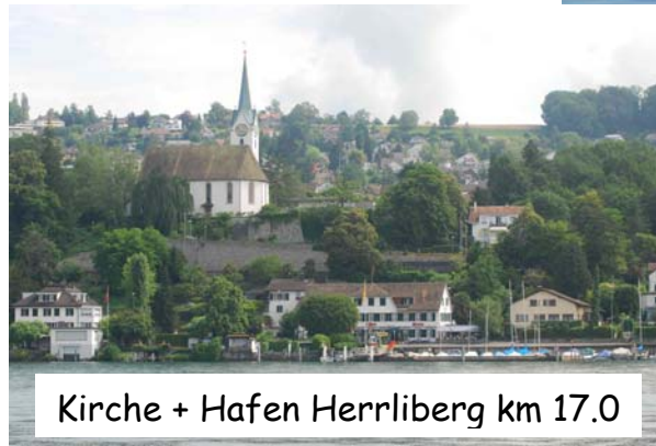
Kirche + Hafen Herrliberg km 17.0