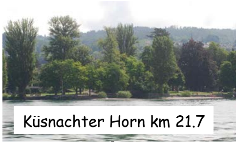
Küsnachter Horn km 21.7