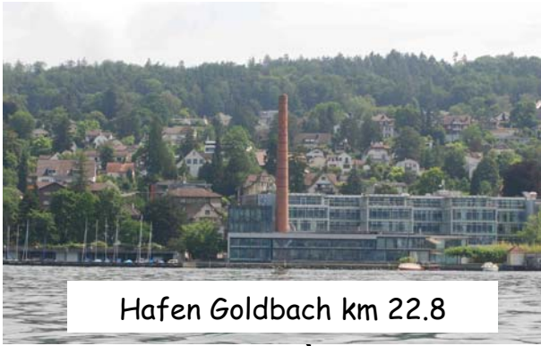
Hafen Goldbach km 22.8