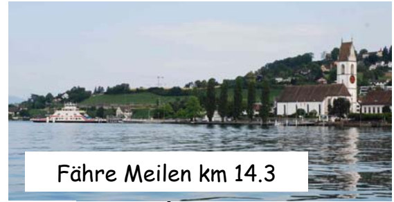
Fähre Meilen km 14.3