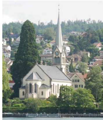
Kirche Erlenbach km 19.6