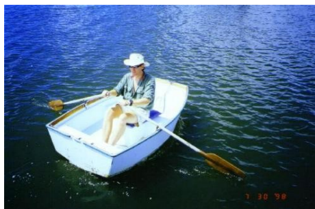
„Nusschalen“ - Ruderboote unter 2.50m

Aus Sicherheitsgründen werden folgende Boote nicht zugelassen: