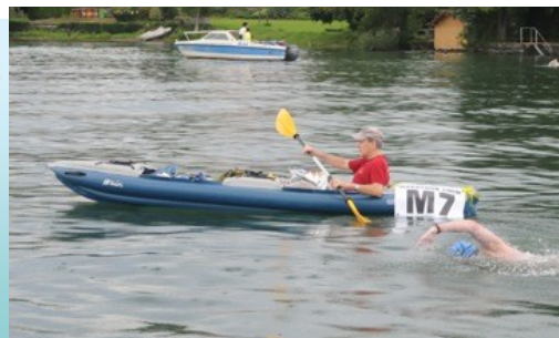
auf dem See

Aus Sicherheitsgründen werden folgende Boote nicht zugelassen: