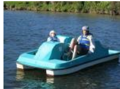
Pedalo und Surfbretter